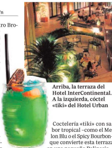
Arriba, la terraza del Hotel InterContinental. A la izquierda, cóctel «tiki» del Hotel Urban