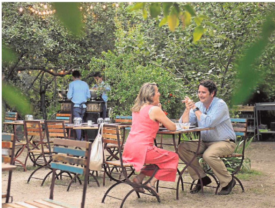
A la izquierda, concierto en el Olivar de Castillejo; arriba, su terraza gastronómica