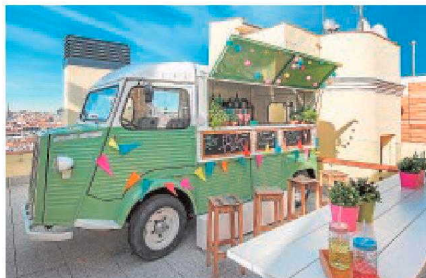
«Food truck» en la azotea del Hotel Vinci The Mint