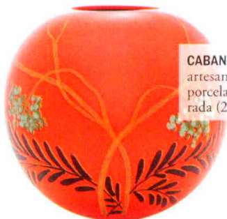
CABANA Florero artesanal de porcelana deco- rada (264 €).