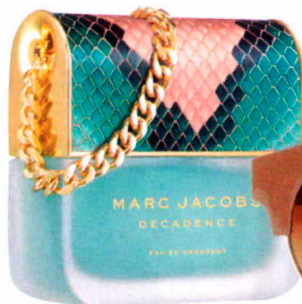
MARC JACOBS 'Eau the Toi- lette Decaden- ce' (96,60 €).