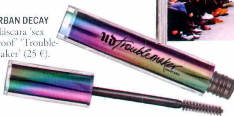
URBAN DECAY Máscara 'sex proof' 'Trouble- maker' (25 €).

Inspírate en los 'looks' de pasarela de 'Catwalking', ponte la máscara 'a prueba de sexo' de Urban Decay y plántate en una fiesta navideña o un 'Brunch Bazar' del hotel Only You Boutique (Barquillo, 21, Madrid).