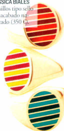
JESSICA BIALES Anillos tipo sello de acabado ma- carado (350 €).