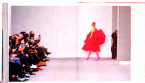
Imagen del libro 'Catwalking', con textos de Alexander Fury y fotos de Chris Moore (Laurence King, 65 €).