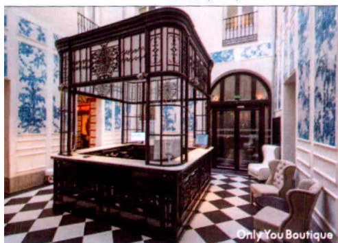
Only You Boutique