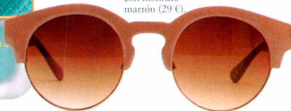
IYÚ DESIGN Gafas de sol con montura marrón (29 €).