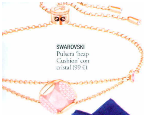
SWAROVSKI Pulsera 'heap Cushion' con cristal (99 €).