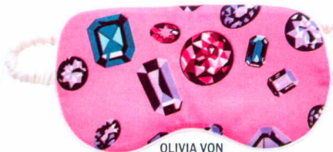
OLIVIA VON HALLE Antifaz reversible 'Pa- tricia' (90 €).