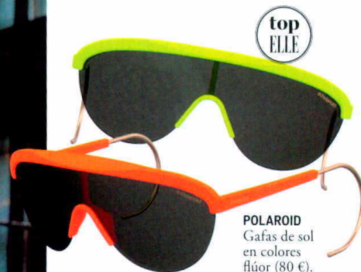
POLAROID Gafas de sol en colores flúor (80 €).

su característico pelo azul, esta joven murciana se ha convertido en todo un icono que ha traspasado las fronteras de nuestro país, lo que le ha llevado incluso a protagonizar uno de los videoclips de Rihanna. ¿Su última hazaña? Poner a bailar a la plaza de Callao, en Madrid, en una sesión especial organizada para celebrar el 80º cumpleaños de la firma Polaroid. Para la española, las gafas de sol